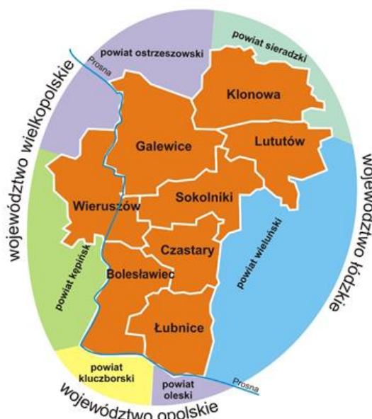
Ryc. 2 Obszar „Między Prosną a Wartą” planowany do objęcia LSR z wyszczególnieniem gmin członkowskich oraz powiatów ościennych (Opracowanie własne)

Całość obszaru leży na terenie Niziny Południowo-Wielkopolskiej, stanowi równinę morenową. Ukształtowanie terenu na całości obszaru jest typowe dla równiny morenowej, czyli lekko pofałdowana powierzchnia terenu (wysokość terenu zawiera się w granicach 150-190 m n.p.m., najwyższe wzniesienie – 202 m n.p.m.). Charakterystyczny jest duży udział terenów rolniczych, zwłaszcza pól uprawnych i występowanie lasów. Jedynym urozmaiceniem krajobrazu jest dolina rzeki Prosną, płynącej przez obszar LSR oraz stanowiącej częściowo granicę pomiędzy Gminami Wieruszów i Galewice. Proсна jest również na pewnych odcinkach granicą obszaru „Między Prosną a Wartą” (co obrazuje Ryc. 2).