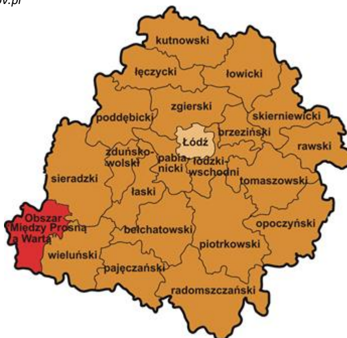
Ryc. 1 Usytuowanie obszaru „Między Prosną a Wartą” na tle mapy powiatów województwa łódzkiego (Opracowanie własne z wykorzystaniem mapki województwa łódzkiego)

Stan na 31.12.2020 r.